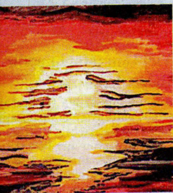
Der Künstler lebte einige Jahre in Afrika.

Infos bei der Hochwald-Touristik Weiskirchen unter Telefon (0 68 76) 7 09 37.